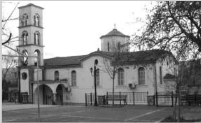
Η εκκλησία της Παλαιοβράχας

μαζί με τις αποσκευές τους περίμεναν στη σειρά για την καταγραφή και τον τελικό έλεγχο της υπηρεσίας Μετανάστευσης, στο κτίριο του Ellis Island (νησιού Έλλης), που οι Έλληνες το έλεγαν «Καστιγγάρι».